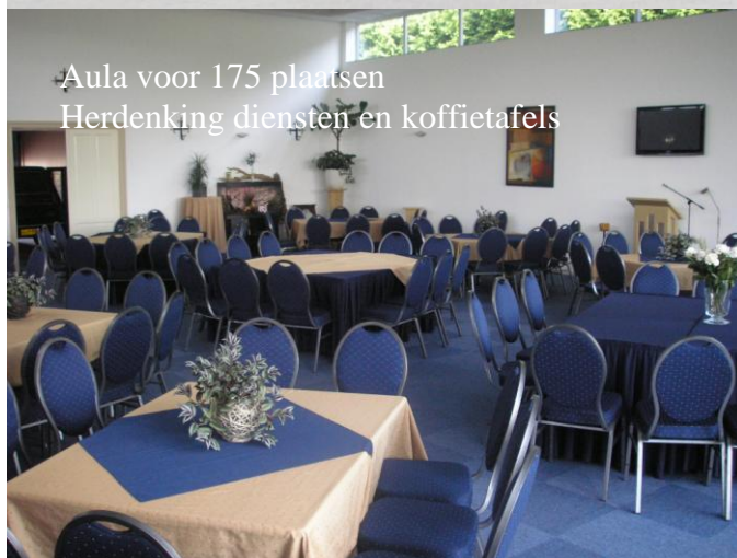
Aula voor 175 plaatsen Herdenking diensten en koffietafels