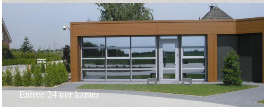
Entree 24 uur kamer